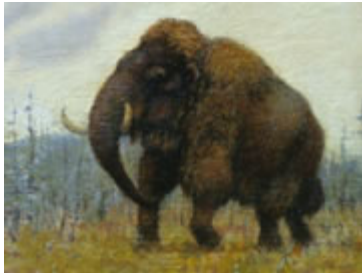
Das Eiszeit-Zotteltier Mammuthus primigenius , ein Gemälde v. K. K. Flerov, Foto: Senckenberg Forschungsinstitute.

Von Doris von Eiff EM 08-09 · 03.08.2009