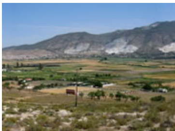
Die einstige Heimat des spanischen Mammute. Bild der Landschaft von Padul/Granada, wie sie heute aussieht. Regionen unterschieden haben. Es war die gleiche Art“, ergänzt Dick Mol, Eiszeitexperte am Naturmuseum Rotterdam.

Die fossilen Überreste der Padul-Mammute wurden in einem wissenschaftlichen Kooperationsprojekt von einer internationalen Forschergruppe untersucht. An der Studie beteiligt sind die Senckenberg Forschungsinstitute mit der Abteilung für Quartärpaläontologie in Weimar, die Universitäten Madrid und Oviedo, sowie das Naturmuseum Rotterdam.